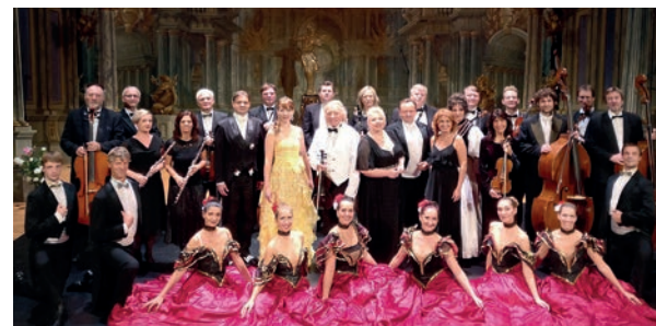
So., 05.05./15.30 Uhr „Die große Johann Strauß-Gala“ mit Orchester, Solisten und Ballett vom Gala-Sinfonie-Orchester Prag