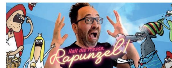
Do., 17.10./12.00 Uhr „Halt die Fresse, Rapunzel!“ Die Cartoon-Show von Piero Masztalerz mit Märchen, Musik und seiner Mutter