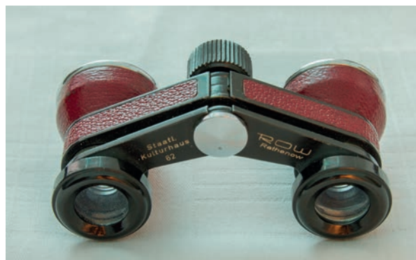
Theaterglas „THEASTAR“ Sonderedition für das Staatliche Kulturhaus

Ausstellungseröffnung: Dienstag, 25. Juni, 18.00 Uhr Ausstellungszeitraum: bis 18. August Ausstellungsort: „Kulturkantine“ (im Eingangsbereich des Kulturzentrums)